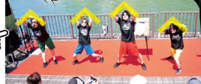
オイオイのパフォーマンスや講座中に表す時は頭の上で勢いよく 「YEAH!」と表しましょう! 楽しい気持ちになること間違いなし!!