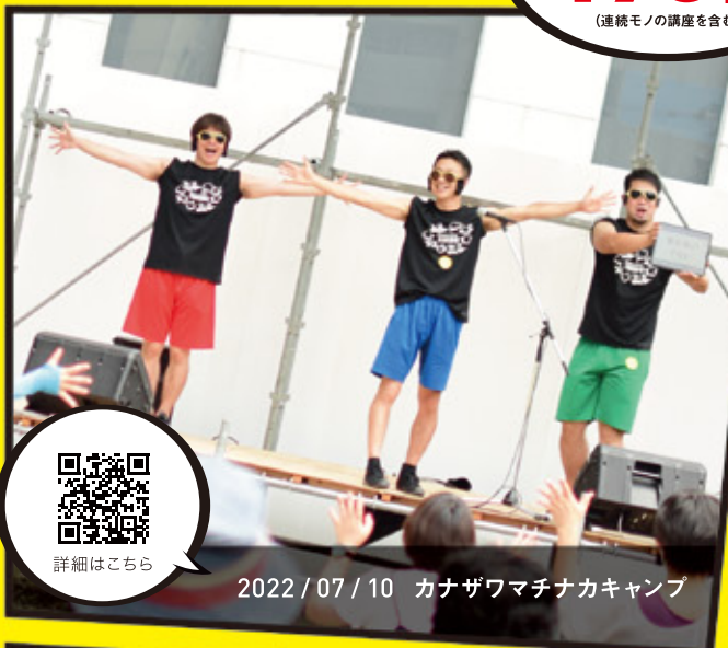
2022 / 07 / 10 カナザワマチナカキャンプ