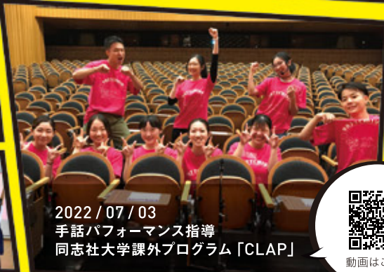
2022 / 07 / 03 手話パフォーマンス指導 同志社大学課外プログラム「CLAP」