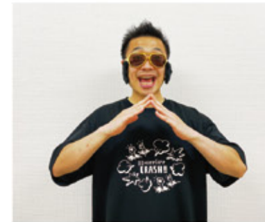
普通はこれでOK! バッチリ!! ※普通の会話の時は普通に表しましょう(笑)