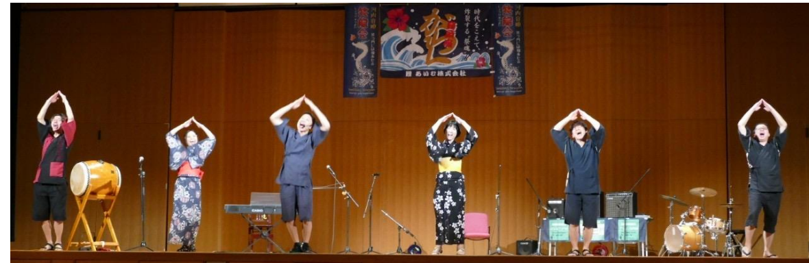
▼第2回わいわい祭り in 十三 ~大阪の老舗キャバレーのステージで披露！~