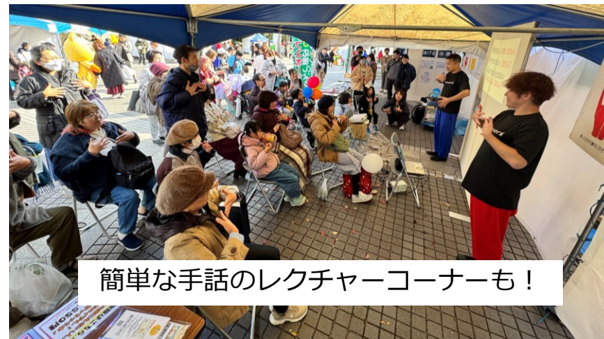
簡単な手話のレクチャーコーナーも！