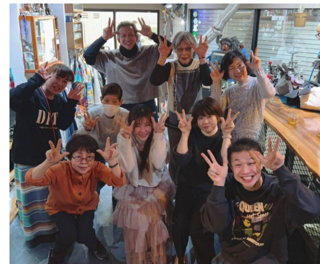
みんなで楽しむ手話講座 & 手話体操▲

@大阪 @WEB @大阪 @大阪 @大阪 @大阪 @大阪 @大阪 @大阪 @大阪 @WEB