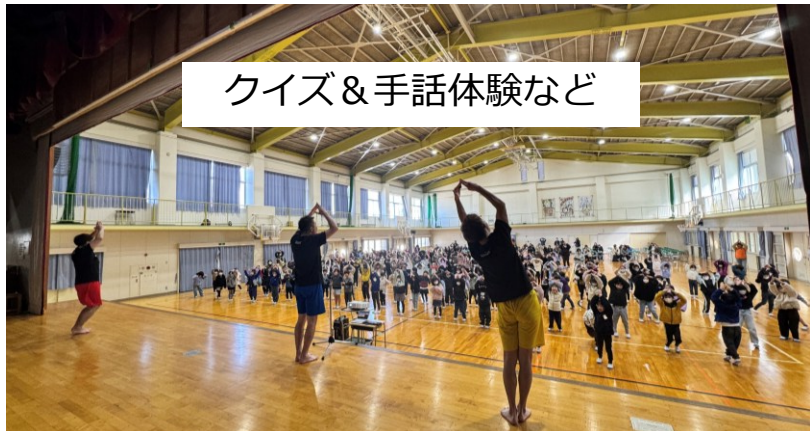
クイズ&手話体験など