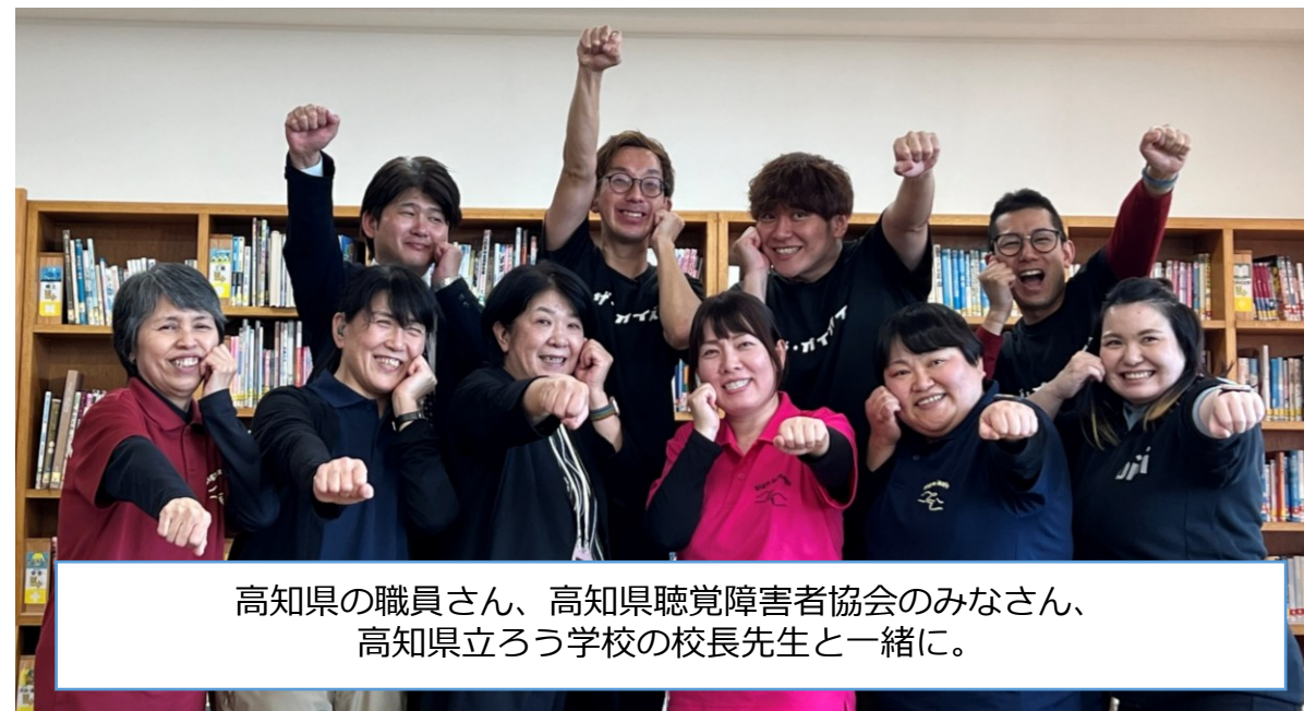
高知県の職員さん、高知県聴覚障害者協会のみなさん、 高知県立ろう学校の校長先生と一緒に。