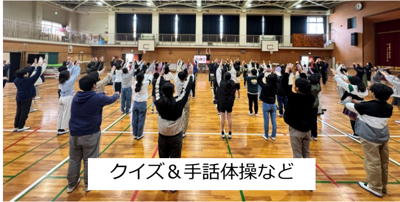
クイズ&手話体操など