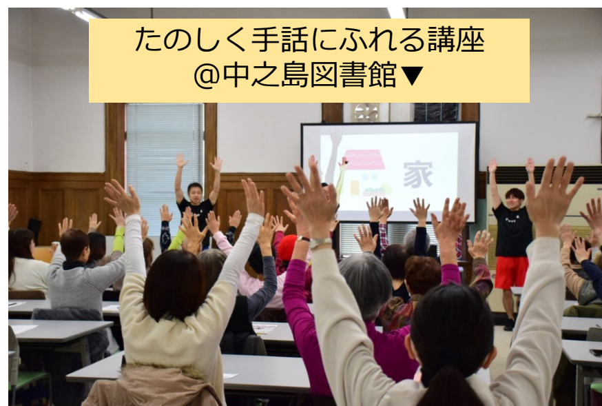
たのしく手話にふれる講座 @中之島図書館▼