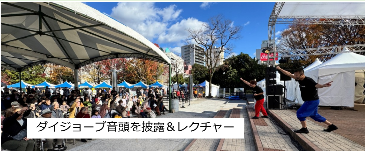
ダイジョーブ音頭を披露&レクチャー