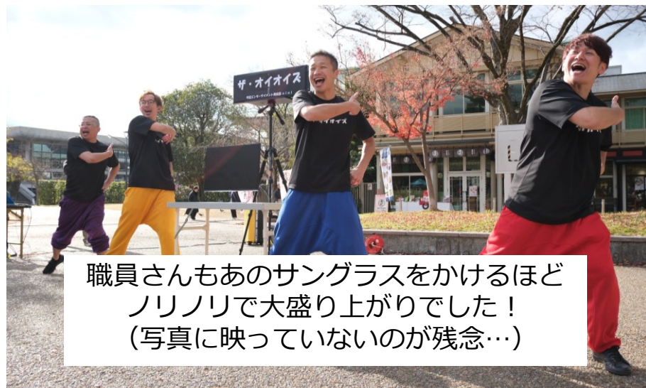
職員さんもあのサングラスをかけるほどノリノリで大盛り上がりでした！ (写真に映っていないのが残念…)