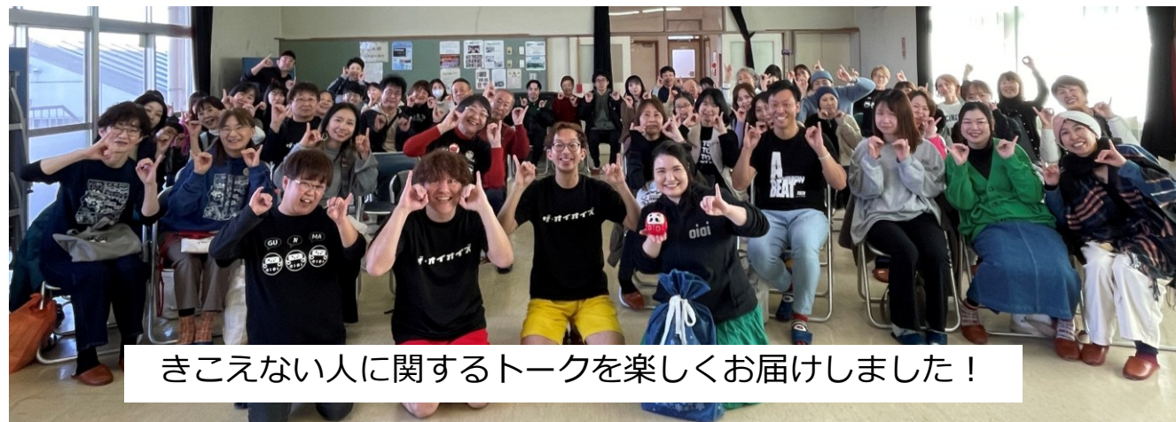
きこえない人に関するトークを楽しくお届けしました！