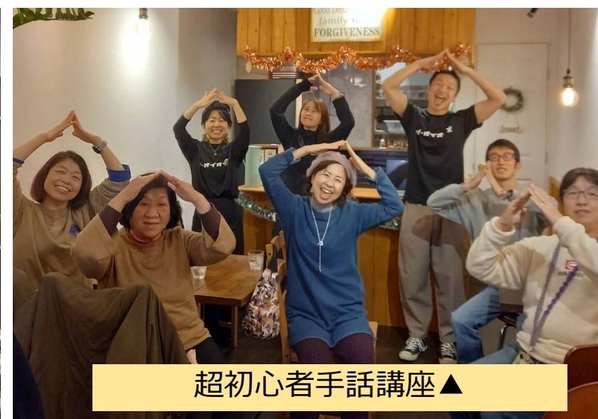
超初心者手話講座▲