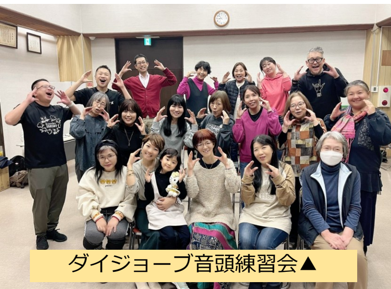
ダイジョーブ音頭練習会▲