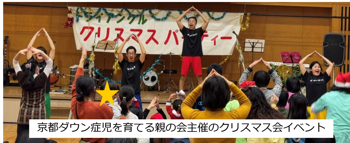
京都ダウン症児を育てる親の会主催のクリスマス会イベント