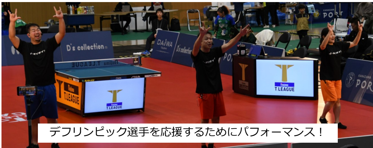
デフリンピック選手を応援するためにパフォーマンス！