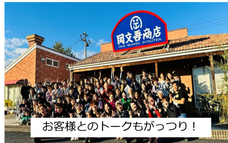
お客様とのトークもがっつり！