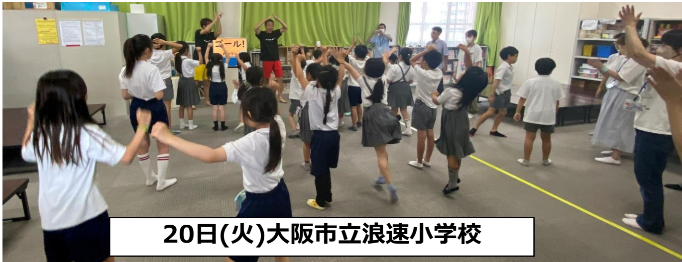
20日(火)大阪市立浪速小学校