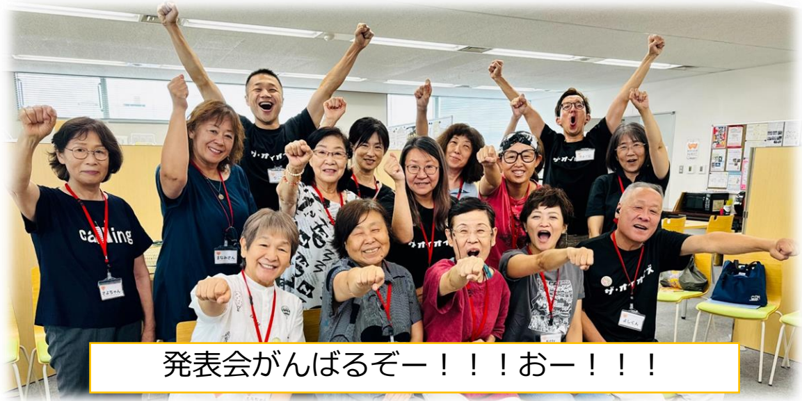
発表会がんばるぞー!!!おー!!!

手話講座の最終回！この日は9月に開催される詩の朗読講座とのコラボ発表会に向けた練習を行いました。詩の朗読に合わせて手話を表す中、受講生のみなさんが自ら「こうした方がもっと伝わりやすいよね」と見て分かる表現の工夫を教えてくださいました。この講座をきっかけに日常のコミュニケーションにも視覚的な表現を取り入れてくださると嬉しいです！