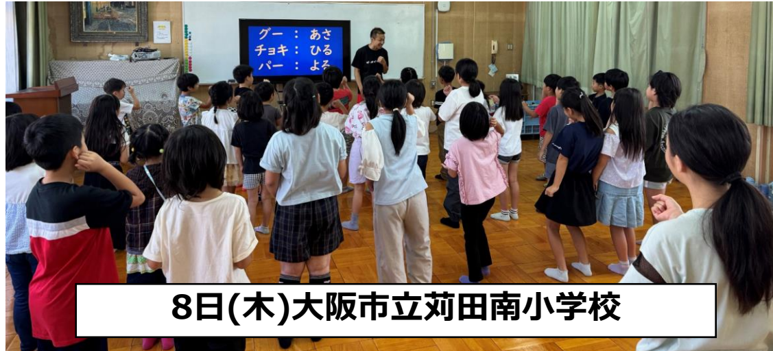
8日(木)大阪市立荻田南小学校

「朝（グー）」「昼（チョキ）」「夜（パー）」の手話を用いた「手話じゃんけん」が大盛り上がり！ 手話じゃんけんを楽しみながら、 全員手話のあいさつができるようになりました。