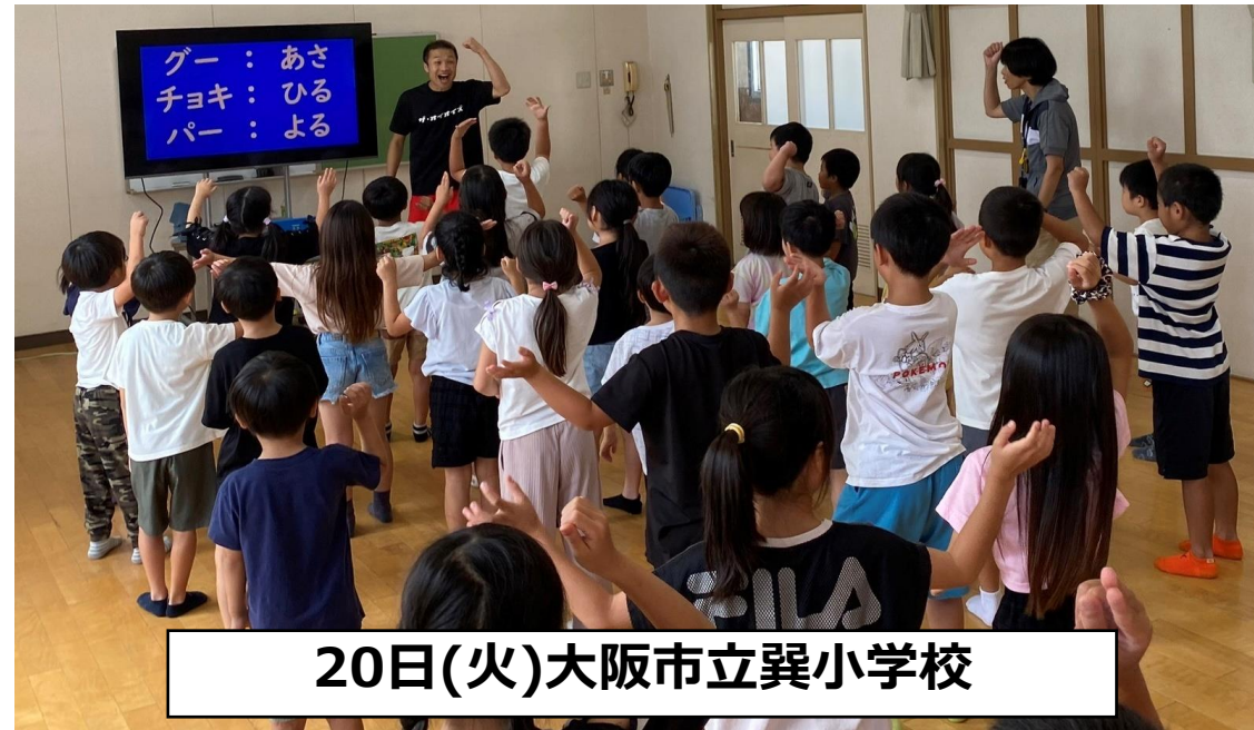
20日(火)大阪市立巽小学校