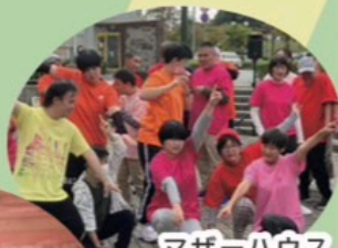
マザーハウス LOVEダンサーズ