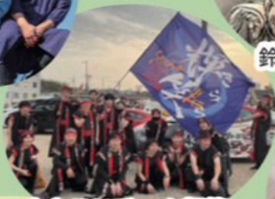
よさこいチーム輝笑