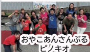
おやこあんさんぶる ピノキオ