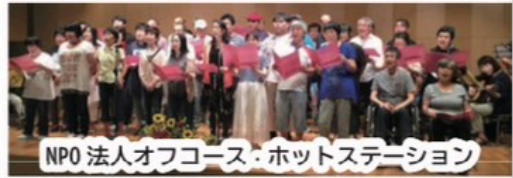
NPO 法人オフコース・ホットステーション