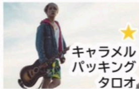
★ キャラメル バックング タロオ