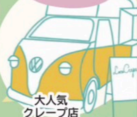
大人気 クレープ店