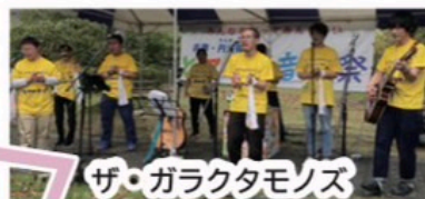
ザ・ガラクタモノズ