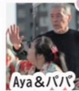
Aya & パパ