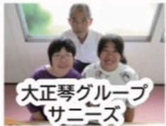
大正琴グループ サニニス