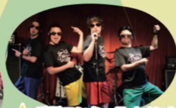
★ 手話エンターテイメント 発信団 oioi