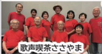
歌声喫茶ささやま