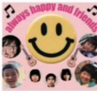
Always happy and friends