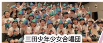
三田少年少女合唱団